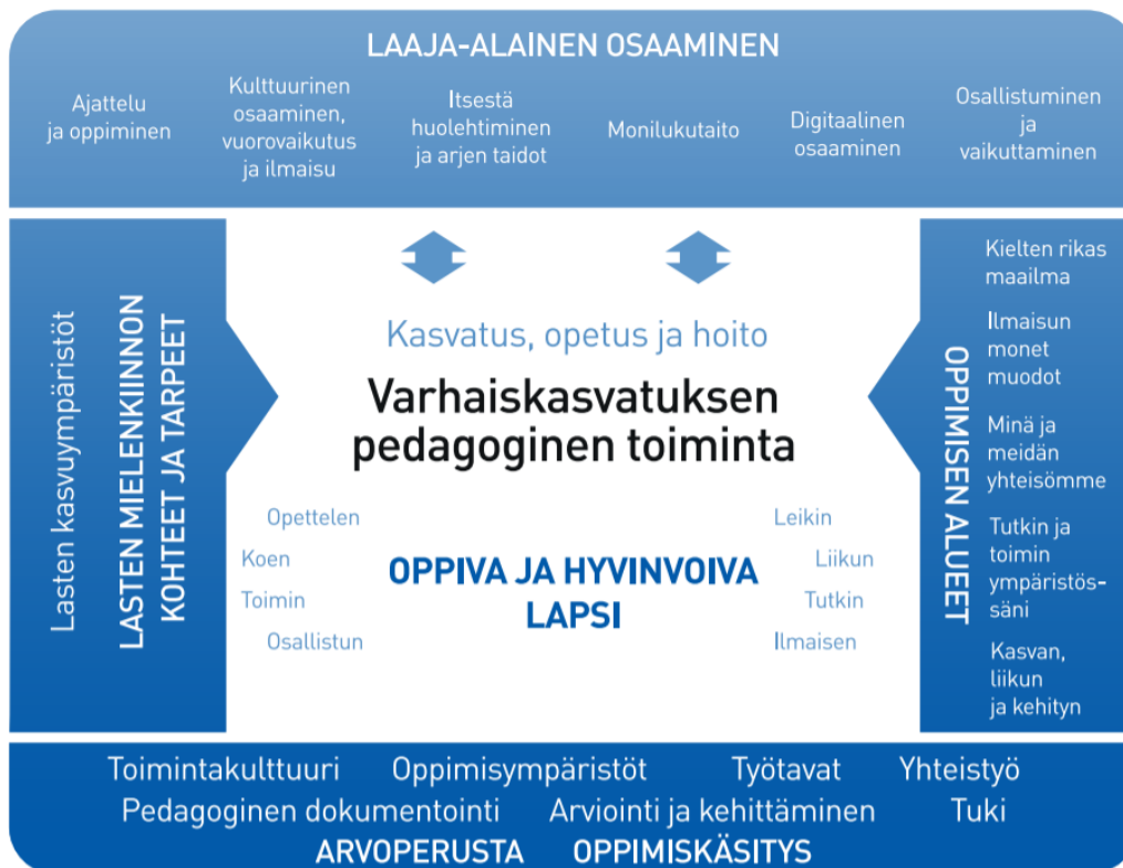
Kuvio 1: Varhaiskasvatuksen pedagogisen toiminnan viitekehys

1). Pedagoginen toiminta toteutuu lasten ja henkilöstön välisessä vuorovaikutuksessa ja yhteisessä toiminnassa. Lasten omaehtoinen, henkilöstön ja lasten yhdessä ideoima sekä henkilöstön suunnittelema toiminta täydentävät toisiaan. Varhaiskasvatuksen pedagoginen toiminta läpäisee kasvatuksen, opetuksen ja hoidon kokonaisuuden.