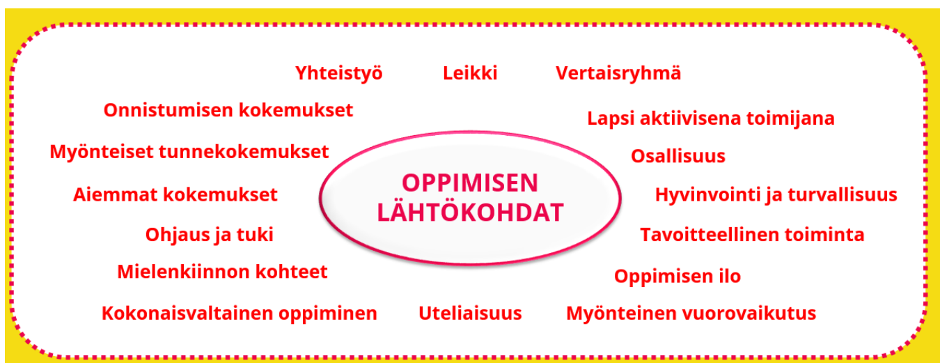
Kaavio 2: Oppimisen lähtökohdat

Riihimäen varhaiskasvatuksessa painotetaan leikin merkitystä oppimisessa. Positiivinen oppimisympäristö ja ilo edistävät lapsen hyvinvointia, kehitystä ja oppimista. Hoidon, kasvatuksen ja opetuksen suunnittelun lähtökohdانا ovat lasten yksilölliset varhaiskasvatussuunnitelmat, joiden pohjalta laaditaan ryhmän tiimivasu ja yksikön toimintasuunnitelma. Lapselle jokainen päivän hetki on tärkeä kasvatuksen, opetuksen ja