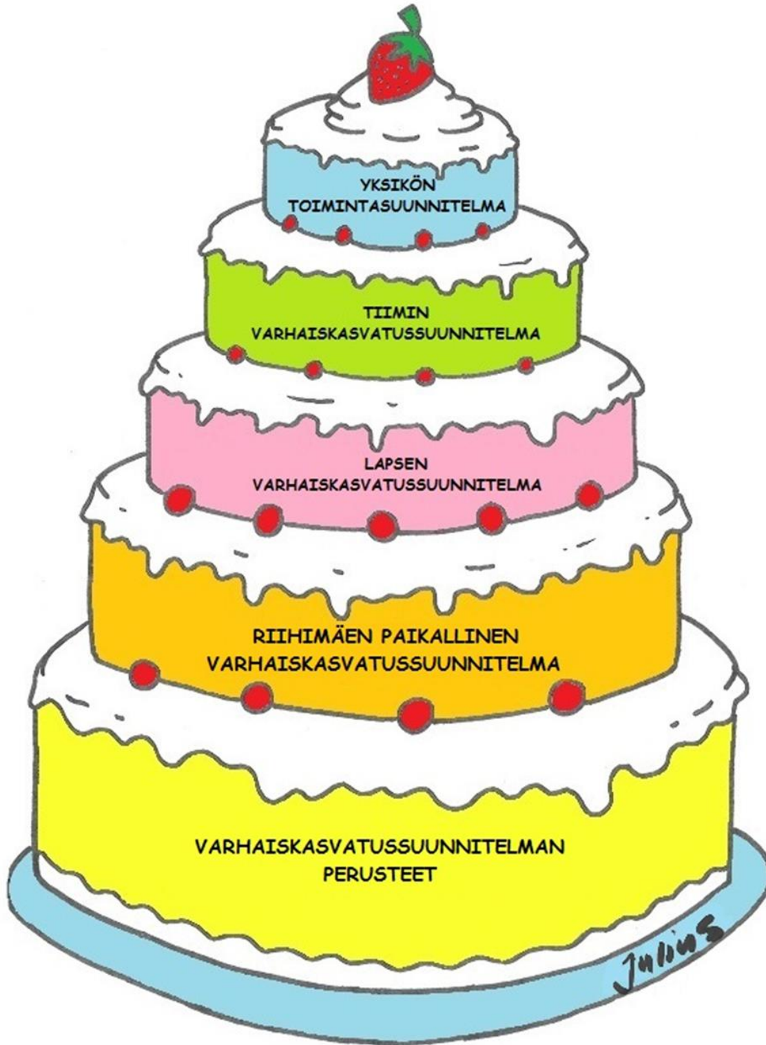
Kuva 1: Riihimäen kaupungin varhaiskasvatussuunnitelma.