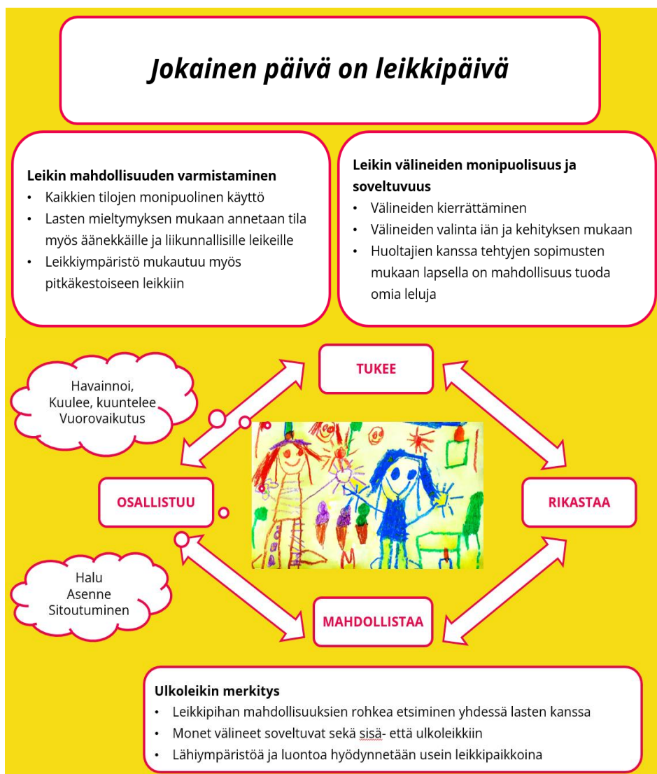
Kuvio 2: Jokainen päivä on leikkipäivä