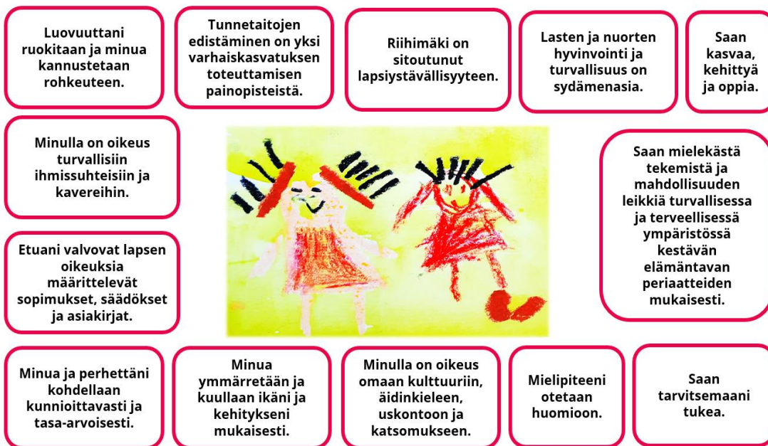
Kuva 3: Mitä riihimäkeläinen lapsi saa?