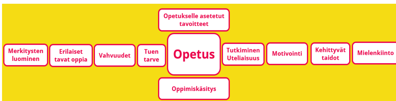
Kaavio 4: Riihimäen näkökulma opetuksessa

Varhaiskasvatuksessa lapsia innostetaan ja motivoidaan opettelemaan uusia asioita sekä ohjataan käyttämään erilaisia oppimisen tapoja. Opetus tukee ja siinä hyödynnetään lasten luontaista uteliaisuutta ja tutkimisen halua. Opetuksessa otetaan huomioon lasten kehittyvät taidot, mielenkiinnon kohteet, vahvuudet ja yksilölliset tuen tarpeet. Lisäksi opetuksen perustana ovat oppimisympäristöille (luku 3.2), laaja-alaiselle osaamiselle (luku 2.7), pedagogiselle toiminnalle (luku 4), ja lapsen tuelle (luku 5) asetetut tavoitteet.