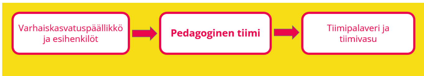
Kaavio 1: Arvojen käsittelyn toimintamalli

luovat pohjan yksiköiden pedagogisten tiimien, tiimivasujen ja koko yksikön toimintasuunnitelmien työstämiselle.