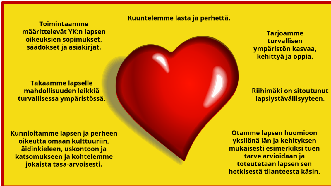
Kuva 2: Mitä Riihimäen varhaiskasvatus antaa?