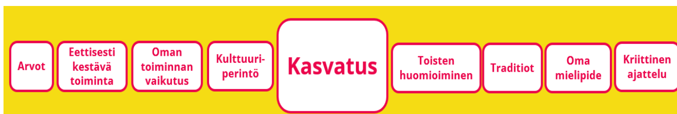
Kaavio 3: Riihimäen näkökulma kasvatuksesta

sivistystehtävänä on ohjata tietoisesti lasten yksilöllisen identiteetin muotoutumista siten, että lapset oppivat havaitsemaan oman toimintansa vaikutukset toisiin ihmisiin ja ympäristöönsä. Lasten kehitystä tuetaan niin, että he oppivat toimimaan sekä käyttämään osaamistaan myös toisten hyväksi.