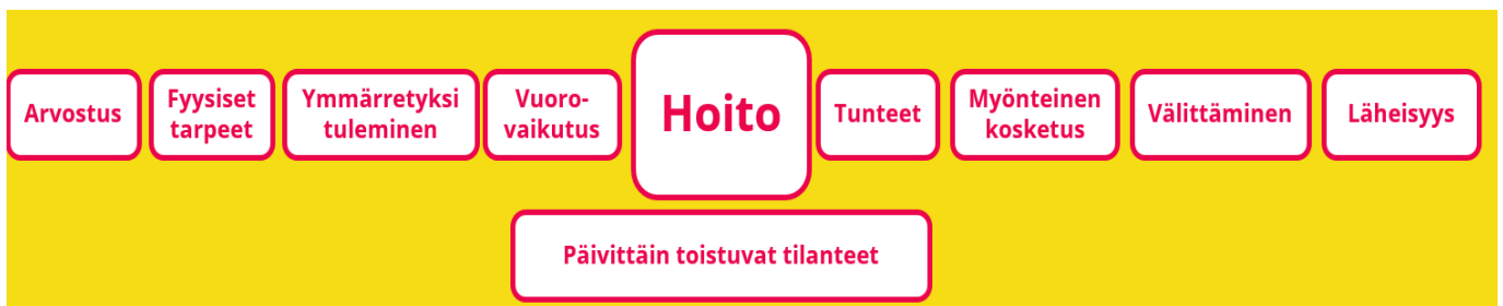
Kaavio 5: Riihimäen näkökulma hoito

Varhaiskasvatuksen hoitotilanteet ovat aina samanaikaisesti kasvatus- ja opetustilanteita, joissa opitaan esimerkiksi vuorovaikutustaitoja, itsestä huolehtimisen taitoja, ajan hallintaa sekä omaksutaan hyviä tottumuksia.