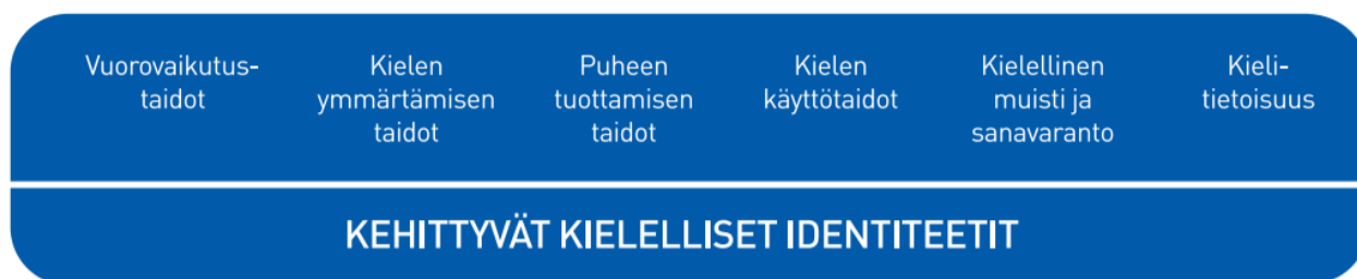
Kaavio 6: Lasten kielen kehityksen keskeiset osa-alueet varhaiskasvatuksessa

Kielen oppimisen kannalta on tärkeää tiedostaa, että saman ikäiset lapset voivat olla eri vaiheissa kielen kehityksen eri osa-alueilla. Kielelliset identiteetit kehittyvät , kun lapsia ohjataan ja tuetaan kielellisten taitojen ja valmiuksien keskeisillä osa-alueilla.